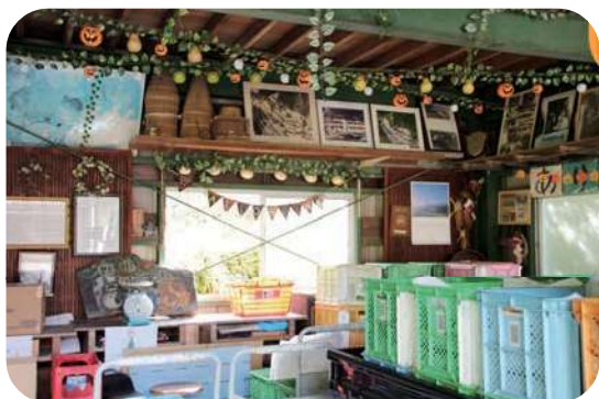
▲妹川小から引き取った写真などを展示した作業小屋