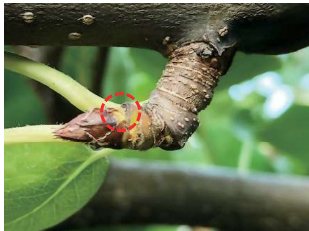
写真2 秋季における芽基部の緩み (菌の侵入口となります)