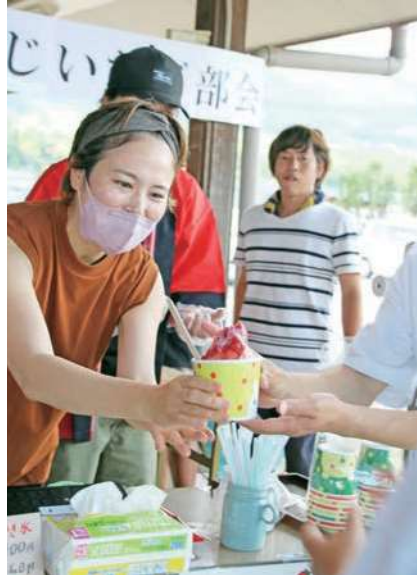
▲色鮮やかに仕上がったあまおうかき氷

暑い夏に「あまおう」を満喫してほしいと、JAにじいちご部会青年部は8月11日と12日、JAの「にじの耳納の里」で、あまおうかき氷を出店しました。あまおうの新たな楽しみ方を提案していくきっかけにと初めて企画しました。シロップは部員らが冷凍保存しておいたあまおうを100%使用。氷にかけるとあまおうの特徴である鮮やかな赤に染まり、部員らは「損はしない美味しさ。ぜひ味わって」とPRしました。