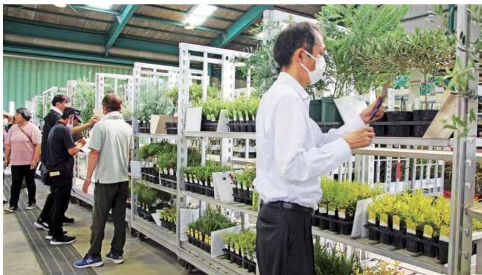
▲展示会で情報収集する市場関係者ら