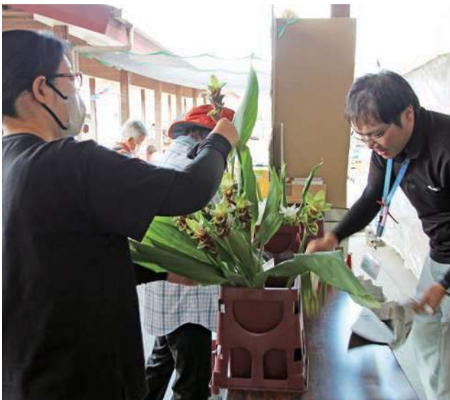
▲連日盛況だった即売会

夏の花として人気上昇中の「クルクマ」を広くPRしようと、JAにじクルクマ研究会は8月11日から13日まで、JAの「にじの耳納の里」で即売会を開きました。花の需要が高まる盆期間中を選び「ホワイトマリアージュ」「チェンライスノー」「オールドローズ」など全10数種を店頭で販売。連日午前中には無くなる人気で、準備した2000本を完売しました。