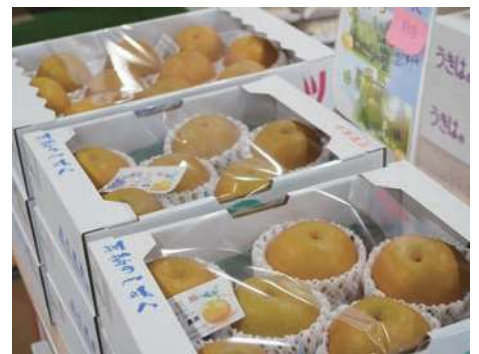
季節に応じた旬の野菜や果物