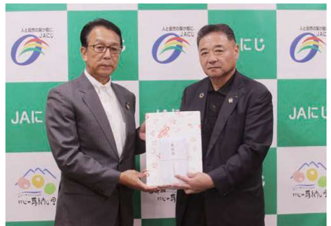
▲JAはだの宮永組合長(左)から義援金を受け取る右田組合長(右)