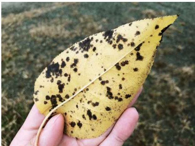
写真1 「黒星病」罹病落葉 (越冬し翌年の感染源となります)