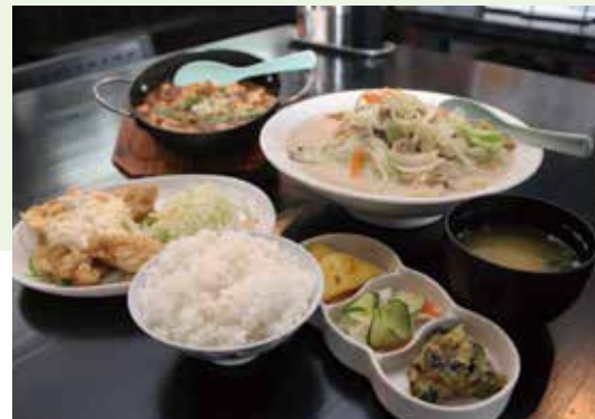
人気メニューの波平ちゃんぽん、麻婆豆腐、チキン南蛮