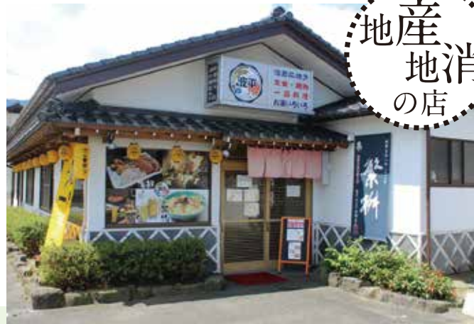
国道210号線沿いにあります